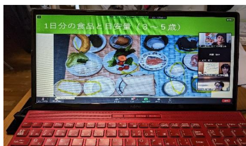
オンラインでの受講